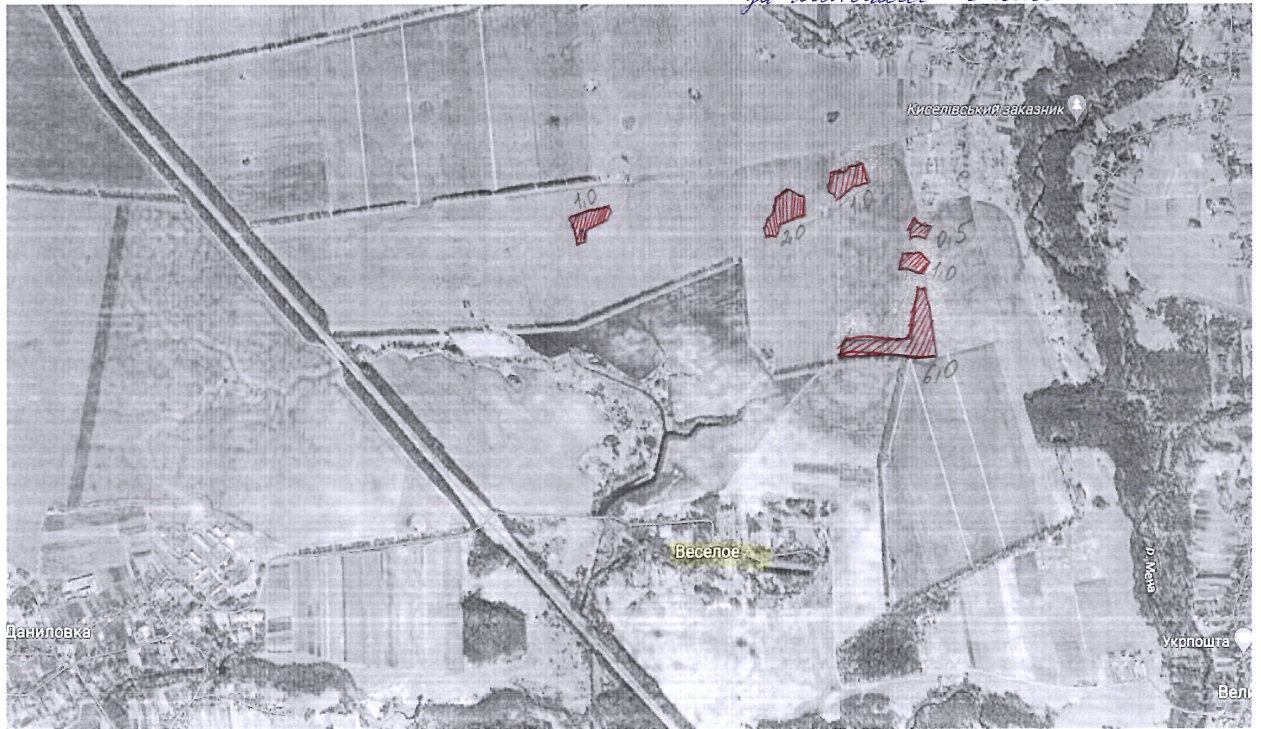
Схема розміщення земельних ділянок №5 за м.п.д.м. с. Киселівка 44.5 га

В.О. начальника відділу земельних відносин, АПК та екології