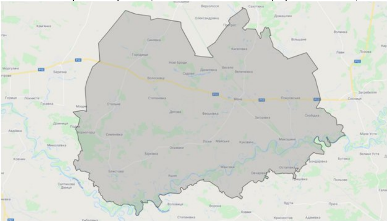
Рис. 1. Карта Менської ОТГ

Громада розташована на півночі Чернігівської області, поряд україно-білоруського та україно-російського кордону. З півдня на північ громаду перетинає ділянка Південно-Західної залізниці з залізничними станціями «Мена» та «Макошине». Через громаду проходять автотраси «Чернігів – Новгород-Сіверський», «Чернігів – Семенівка», «Чернігів – Корюківка». З південного заходу на південний схід (наскрізь) територією громади протікає річка Десна. На відстані 69 км. знаходиться місто обласного значення – Чернігів та 226 км. – місто Київ. Відстань від міста Мена до сусідніх колишніх районних центрів становить: 31 км до м. Корюківка, 54 км до м. Сновськ, 20 км до смт Сосниця, 70 км до смт Короп, 106 км до м. Новгород–Сіверський, 107 км до м. Семенівка (через смт Холми).